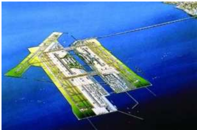
関西国際空港全体構想図