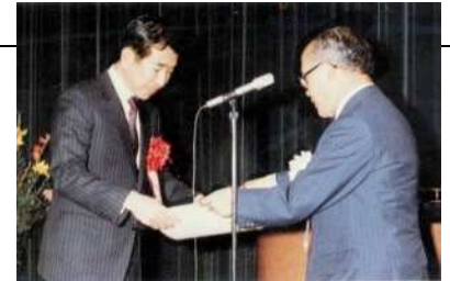
大阪科学賞の授賞式