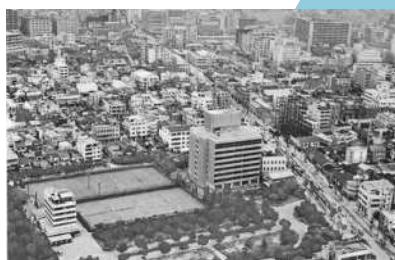
大阪科学技術センター設立