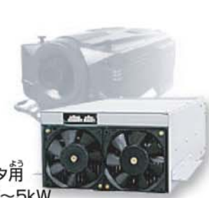
大型プロジェクト用 ランプ電源1kW~5kW