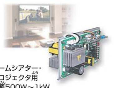
ホームシアター・ プロジェクト用 電源500W~1kW