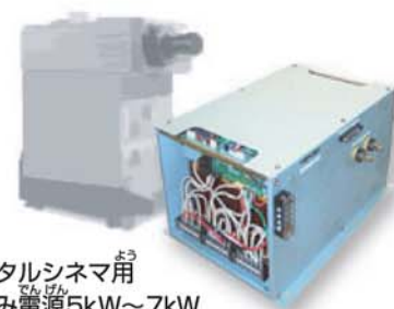
デジタルシネマ用 組込み電源5kW~7kW