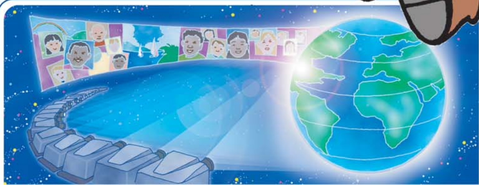
幻想的でリアルな映像のために多くのプロジェクトを使用します。それには高性能な電源装置がかかせません。