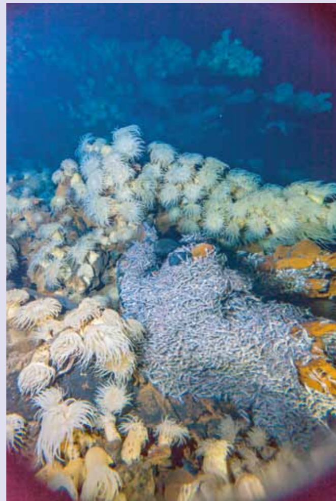
インド洋・エドモンド熱水フィールドの風景 海洋研究開発機構

さまざまな研究過程や 研究成果などで生まれた 美しく感動的な画像を 展示します。