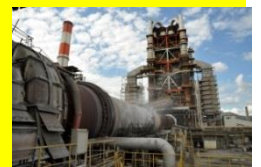
住友大阪セメント(株)赤穂工場のロータリーキルンとプレヒーター

参加費：無料(お弁当は、こちらでご用意します) スケジュール： 8:20 大阪科学技術館 1階 集合 8:30 // 出発(大型貸切バスにて移動) 9:30 明石海峡大橋のアンカレイジ 見学 10:00 // 出発 11:30 住友大阪セメント(株)赤穂工場 着 ~概要説明・昼食・工場見学・実験見学~ 15:00 工場出発 17:00 大阪科学技術館 着、解散