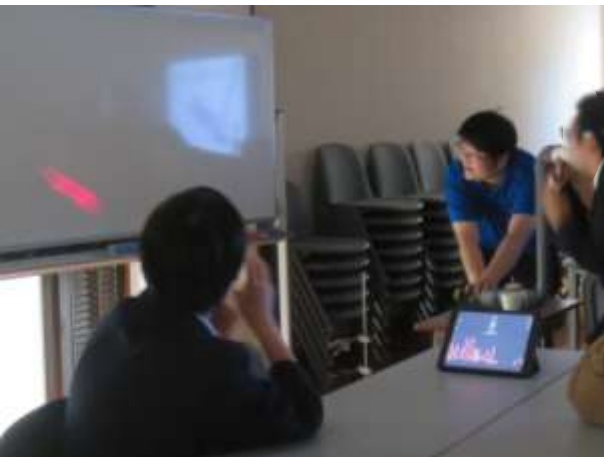
レーザーを使った声の可視化の実験