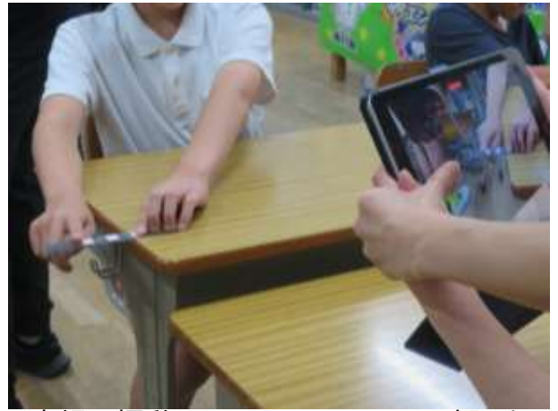
定規の振動をスローモーションで確認する