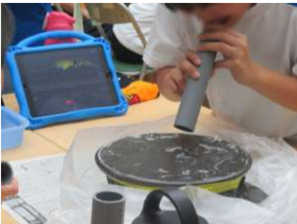
声の振動で塩の粒を動かす実験