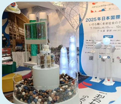
パナソニックグループパビリオン「ノモの国」 協力：パナソニック ホールディングス