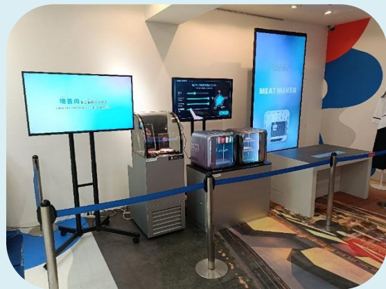
大阪ヘルスケアパビリオンに展示された 「家庭で作る霜降り肉」 協力：培養肉未来創造コンソーシアム