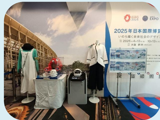
ガスパビリオン「おばけワンダーランド」 協力：大阪ガス